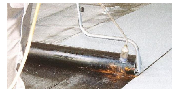
Variantní natavování s rozbalovačem rolí