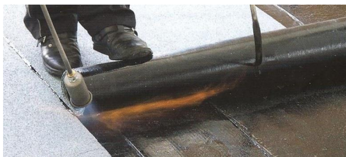
Natavování s navíjecí rolí